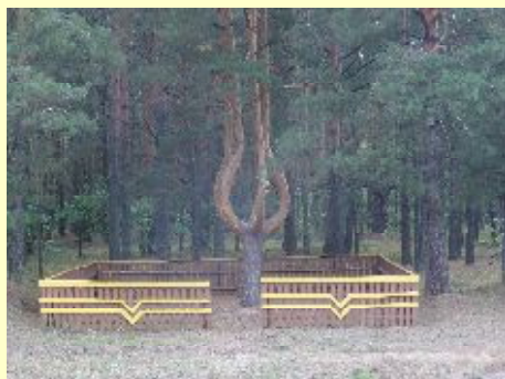
Памятник природы «Сосна обыкновенная»

Памятник природы «Сосна обыкновенная» уникальный памятник природы сосна обыкновенная с пятью стволами.