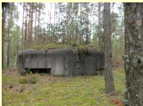
ДОТы «Линия Ворошилова»

В 30-е годы вдоль границы с буржуазной Польшей была построена укрепленная линия, которую народ называл «линией Ворошилова». В Волавске дислоцировалась военная часть. И сегодня немymi свидетелями тех времен являются долговременные оборонительные точки (ДОТы) из железобетона в лесах и на полях Волавска и других деревень. Из них не было сделано ни одного выстрела. Всего на территории Волавского лесничества насчитывается около 12 ДОТов.