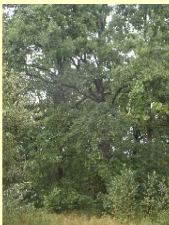
Памятник природы «Дубравы (насаждения дуба)»

Дуб - мощное крепкое дерево, издавна считавшийся самым крепким и могучим деревом и отождествлялся с силой, мудростью и здоровьем. Древесина дуба твердая, пористая, но прочная и стойкая против гниения. Преимущество дуба - долговечность и стойкость к влаге. Самая распространенная порода дуба – черешчатый или, так называемый летний. Дуб используется для изготовления скульптурных резных изделий, в мебельном производстве и для изготовления паркета. Древесину дуба применяют при изготовлении шпона для отделки других пород древесины, а также производстве бочек для пива и вина.